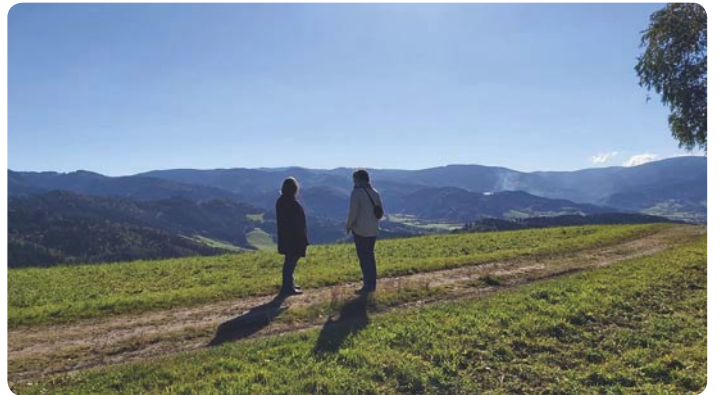
Klausurwochenende in Maria Lindenberg