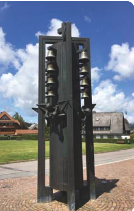
Glockenspiel bei der Kirche »Zu den Zwölf Aposteln«, Hinterzarten, Adlerweg 11,

Kirche (unten) Adlerweg 13 79856 Hinterzarten