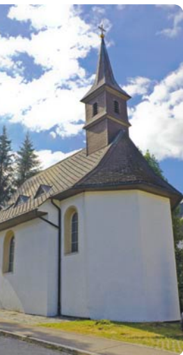
Bärenhofkapelle in Titisee, 79822 Titisee-Neustadt, Kapellenweg 2, (nach der Abfahrt von der B31 gleich rechts ab und wieder rechts in den Kapellenweg einbiegen)