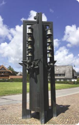
Glockenspiel bei der Kirche zu den 12 Aposteln, Hinterzarten, Adlerweg 11,

Kirche (unten) Adlerweg 13 79856 Hinterzarten