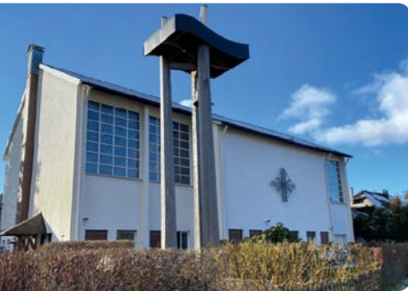
Unten: Die Kirche »Zu den Zwölf Aposteln«, Adlerweg 13 79856 Hinterzarten