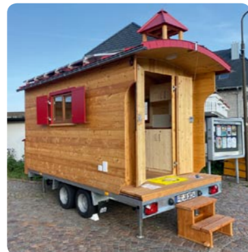
Schäferwagenkirche (wenn sie nicht unterwegs ist: neben dem Glockenspiel, Adlerweg 11)