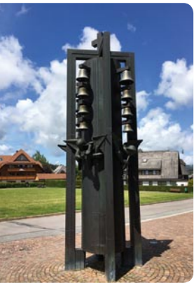
Glockenspiel vor dem Evangelischen Pfarrhaus Hinterzarten, Adlerweg 11