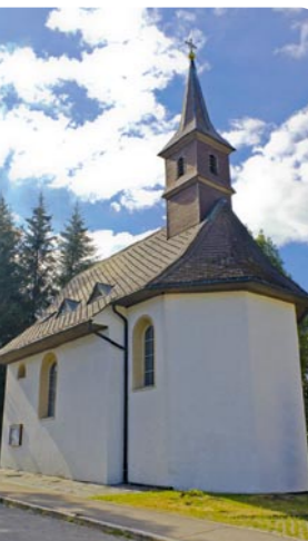
Bärenhofkapelle in Titisee, 79822 Titisee-Neustadt, Kapellenweg 2, (nach der Abfahrt von der B31 gleich rechts ab und wieder rechts in den Kapellenweg einbiegen)