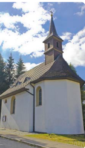
Bärenhofkapelle in Titisee, 79822 Titisee-Neustadt, Kapellenweg 2, (nach der Abfahrt von der B31 gleich rechts ab und wieder rechts in den Kapellenweg einbiegen)

Schäferwagenkirche (wenn sie nicht unterwegs ist: neben dem Glockenspiel, Adlerweg 11)