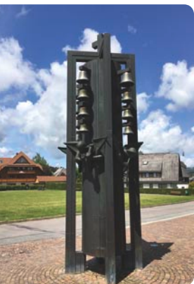
Glockenspiel vor dem Evangelischen Pfarrhaus Hinterzarten, Adlerweg 11

Unten: Die Kirche »Zu den Zwölf Aposteln«, Adlerweg 13 79856 Hinterzarten